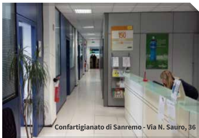
Confartigianato di Sanremo - Via N. Sauro, 36

CONTRIBUTI E/A FONDO PERDUTO Fideiussione a garanzia del pagamento delle anticipazioni di contributi Statali e Regionali - P.O.R.- P.O.N.- AGEA Fideiussione per la richiesta di contributi Europei