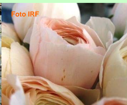
Sintomi di muffa grigia su fiore di ranuncolo in post raccolta