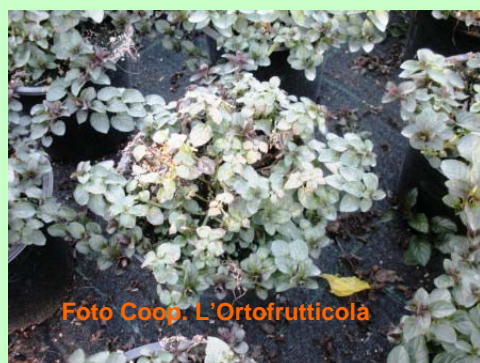
Menta glaciale: attacco di ragnetto rosso