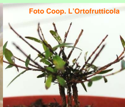
Attacco di cocciniglia su piantine di mirto.

Lavoro svolto nell'ambito del Programma Obiettivo Cooperazione territoriale europea 2007/2013 – Alpi Latine Cooperazione Transfrontaliera ALCOTRA – Progetto n. 264 "ECOLEGO".