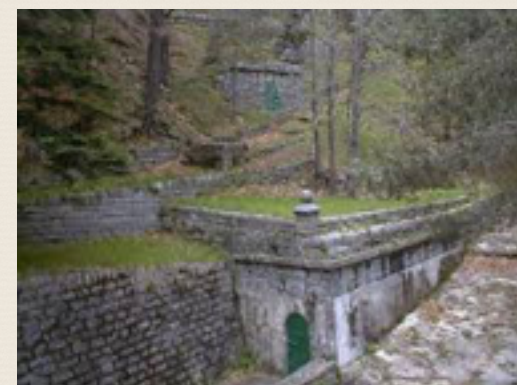
La fonte Marsaglia

Il giorno 4 maggio alle ore 16:30 si terrà il secondo di quattro incontri sulle nostre radici. Il tema portante del pomeriggio sarà la fonte più preziosa in assoluto: l'acqua e, di conseguenza, la nascita dell'AMAIE, azienda municipalizzata che da decenni gestisce l'erogazione dell'acqua e che negli ultimi anni ha anche avuto un enorme sviluppo in tema di energia elettrica. Sarà l'occasione per conoscere ulteriormente la nostra storia e le nostre radici culturali in questo percorso pieno di curiosità.