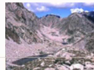
Una splendida vetta

Documentario di Roberto Pecchinino, unico per la professionalità e la capacità di aver utilizzato poesia, storia e tradizioni che riescono a valorizzare il nostro territorio grazie ad una perfetta fusione fra mare e montagna, valorizzando sia l'ambiente marino che quello delle Alpi Liguri. Per questa ragione Pecchinino ha meritato il Premio UNICAM dell'Università di Camerino.