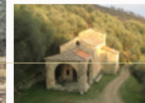
La chiesa di S. Anna di Vasia tra gli ulivi