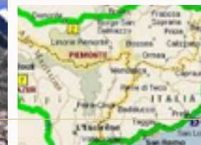
Mappa delle Alpi Marittime