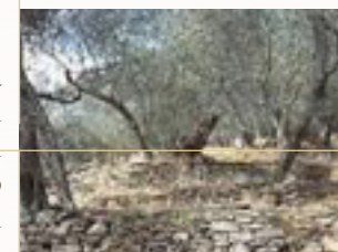
Morbi integer molestie, amet suspendisse morbi