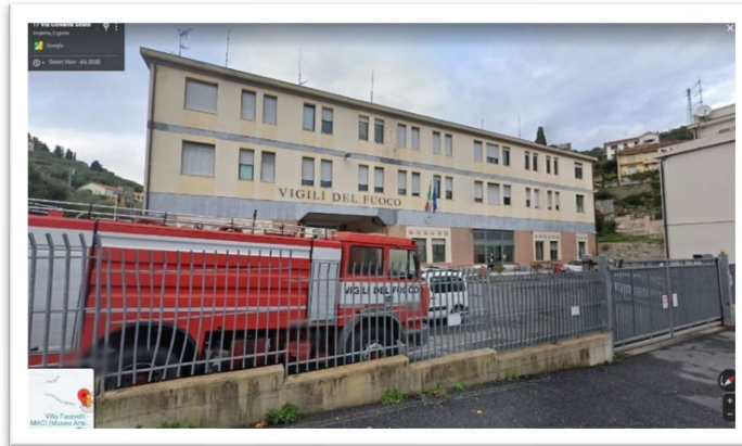
Sede Centrale – Imperia Via Giovanni Strato, 2

Le sedi operative dei Vigili del Fuoco, in provincia di Imperia sono tre: la sede Centrale di Imperia, la sede distaccata di Sanremo e la sede distaccata di Ventimiglia.