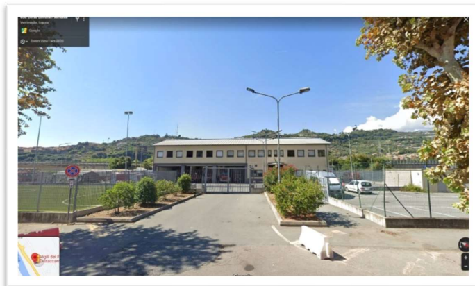
Distaccamento di Ventimiglia – Ventimiglia Corso Limone Piemonte, 7