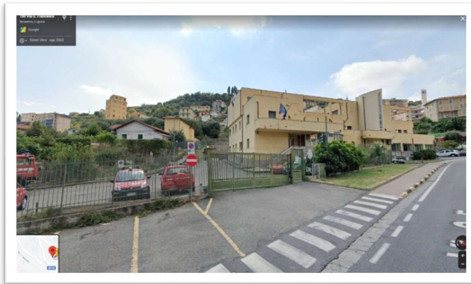
Distaccamento di Sanremo – Sanremo Via San Francesco, 333