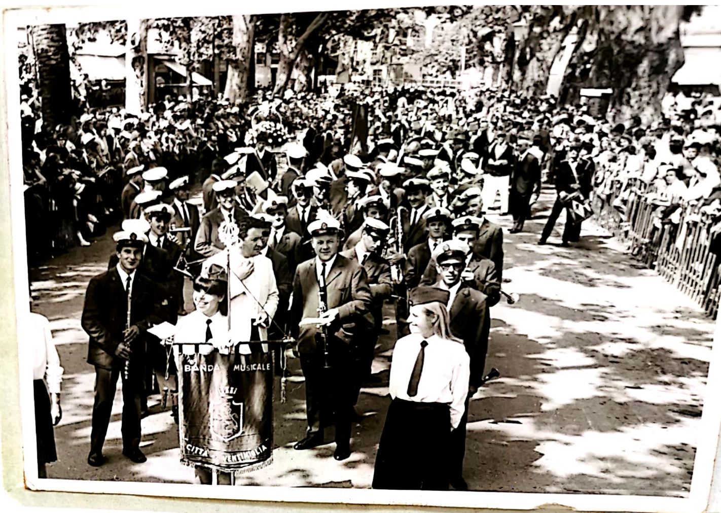
BATTAGLIA FIORI 1967.

sica — norizza- i», l'ar- isale al samento orenzi. I succedu- mi scu- o traccia i un ter-