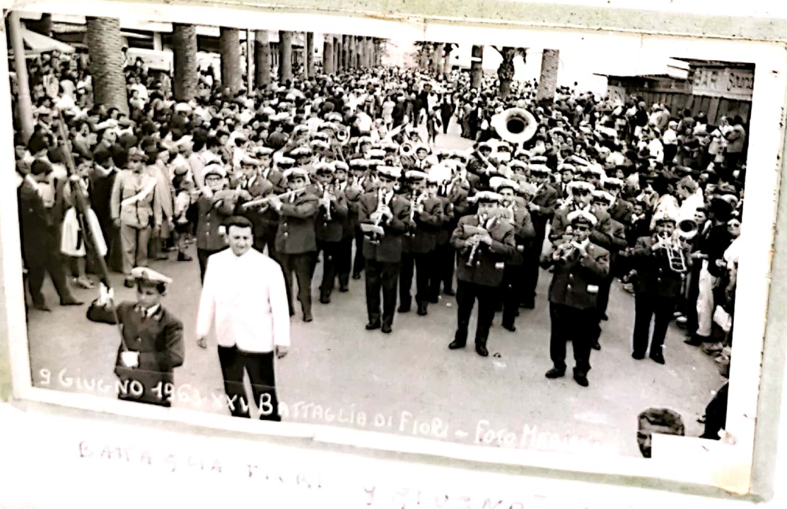
9 GIUGNO 1963 - V.M. BATTAGLIA DI FIORI - Foto Massimo