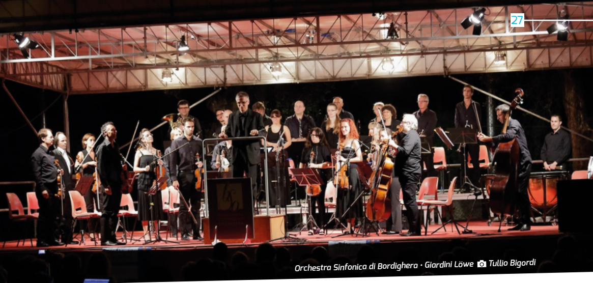
Orchestra Sinfonica di Bordighera · Giardini Löwe