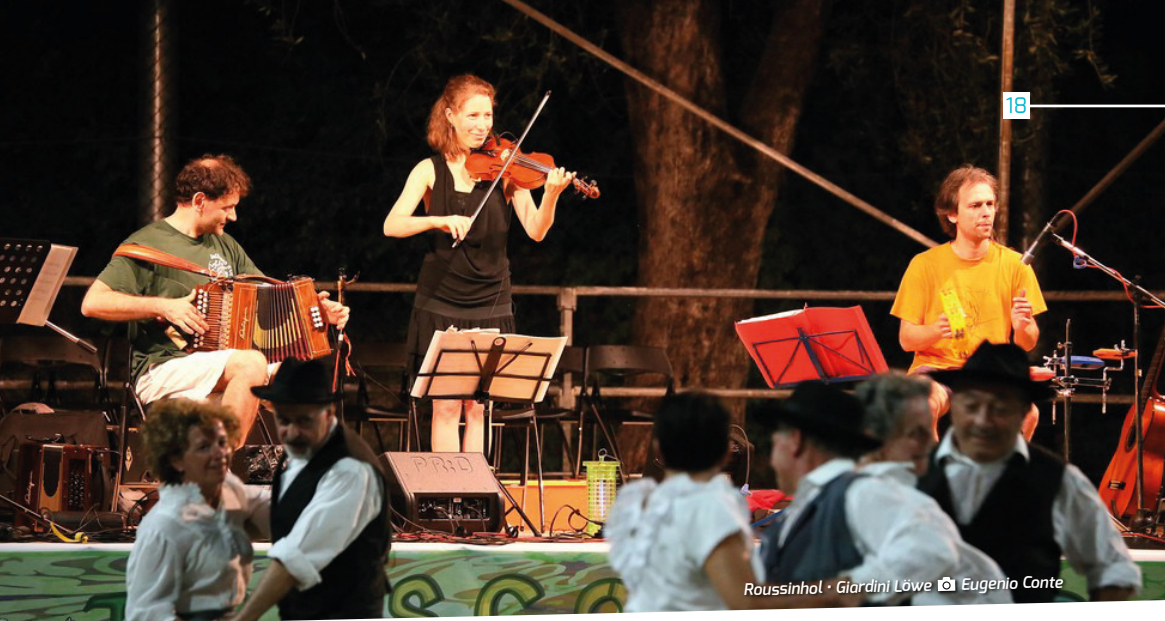
Roussinhol · Giardini Löwe