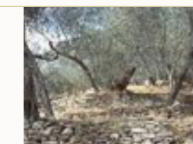
Morbi integer molestie, amet suspendisse morbi