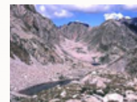
Una splendida vetta

Documentario di Roberto Pecchinino, unico per la professionalità e la capacità di aver utilizzato poesia, storia e tradizioni che riescono a valorizzare il nostro territorio grazie ad una perfetta fusione fra mare e montagna, valorizzando sia l'ambiente marino che quello delle Alpi Liguri. Per questa ragione Pecchinino ha meritato il Premio UNICAM dell'Università di Camerino.