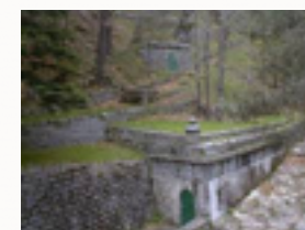
La fonte Marsaglia

Non è possibile parlare di acqua a Sanremo senza descrivere la grande realtà che si è imposta negli anni: l'Amaie. La costituzione dell'Azienda risale al 1910, con la municipalizzazione dell'Acquedotto. Da allora ad oggi sono cambiate molte cose, ma molte sono le vicende e le curiosità legate al più prezioso dei beni: l'acqua. Ecco il modo migliore per scoprirle insieme.