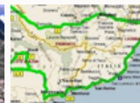
Mappa delle Alpi Marittime