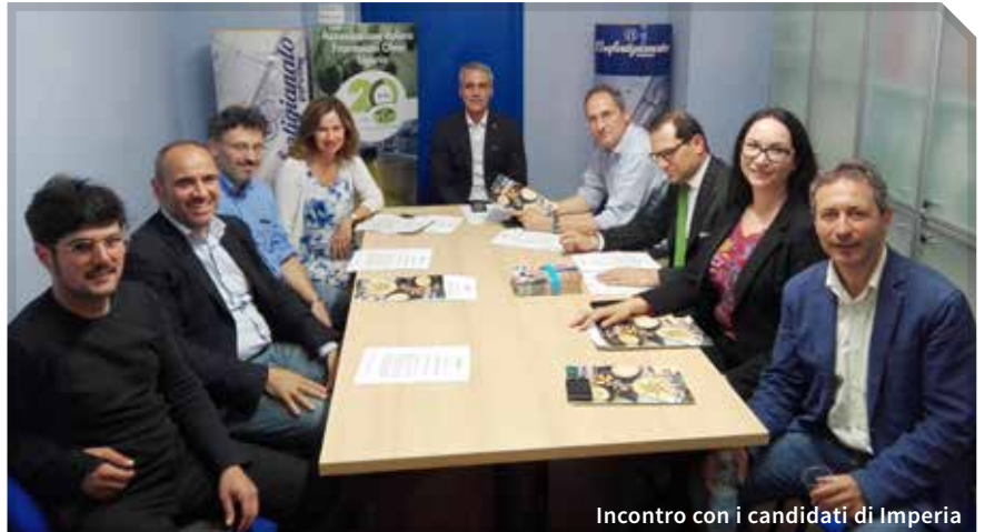
Incontro con i candidati di Imperia

Altri temi proposti dalla Confartigianato hanno riguardato il sostegno all'occupazione giovanile, lo sviluppo delle imprese 4.0, l'attenzione all'efficientamento energetico, la prosecuzione delle opere urgenti di messa in sicurezza del territorio dal punto di vista idrogeologi-