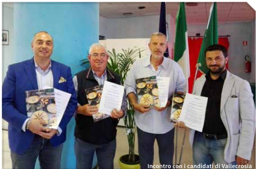
Incontro con i candidati di Vallecrosia