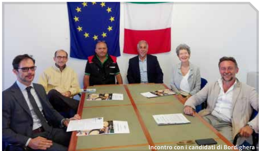
Incontro con i candidati di Bordighera