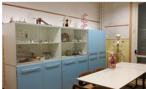
Il laboratorio di Scienze

Un'immagine del musical realizzato dagli alunni del Comprensivo "Sanremo Levante" nell'ambito di un progetto PON.