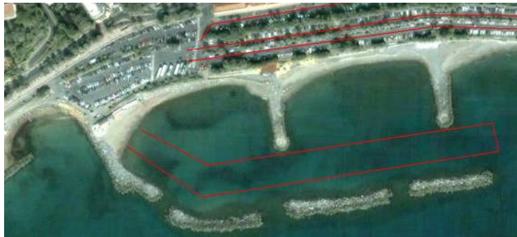
Tempo massimo frazione di nuoto 30'.

Nuoto: Nello specchio acqueo antistante il P.le Carlo Dapporto; sia in caso di mare calmo che in caso di mare mosso o molto mosso, percorso di 0,750 Km con partenza e arrivo Bagni Oasis. Temperatura dell'acqua prevista 14° - 15°.