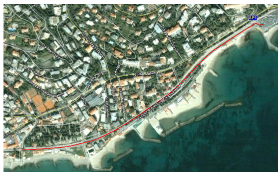
Tempo massimo totale 2h 00'.

Corsa: Il percorso podistico, tutto in riva al mare e completamente pianeggiante, verrà affrontato dagli atleti per 2 volte per un totale di 5 Km sulla pista ciclopeditonale del Parco Costiero del Ponente Ligure. Al termine dell'ultimo giro volata finale per decretare il vincitore sul Lungomare Italo Calvino.